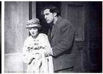
Plano Medio Largo