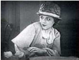
Plano Medio Corto