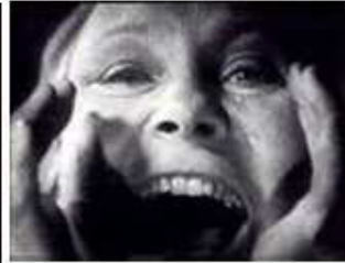
Primerísimo Primer Plano