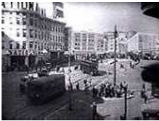
Gran Plano General